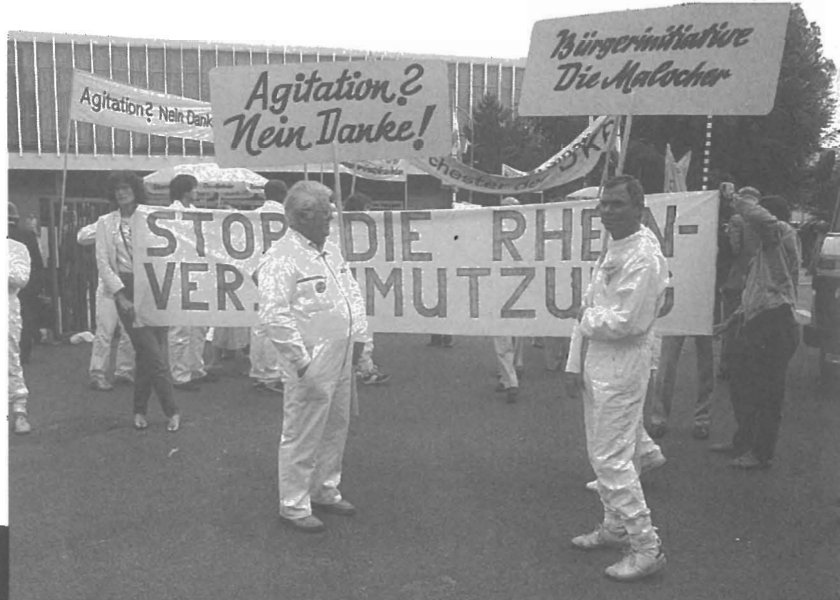
Die »Malocher«-Masche hat sich als zu plump erwiesen.

Wie berichtet (STICHWORT BAYER 5/6 91, S. 20), hat die chemische Industrie in den USA unter Federführung der dortigen BAYER-Niederlassung MILES ein eigenes sog. Dialogkonzept unter dem Namen CARE warenrechtlich schützen lassen, das offiziell zu mehr Transparenz und stärkerer Bürgerbeteiligung führen soll. Tatsächlich aber geht es darum, Kritik frühzeitig aufzuspüren und wenn möglich zu integrieren oder abzufedern. Davon berichtet aktuell das CITIZENS CLEARINGHOUSE FOR HAZARDOUS WASTES (CCHW), ein amerikanisches Anti-Verseuchungs-Netzwerk. CCHW teilt mit, daß die US-Industrie eine sog. Bürgerbewegung unter dem Namen COMMITTEE FOR A CONSTRUCTIVE TOMORROW (C-FACT) ins Leben gerufen hat, das ähnlich wie CARE (oder etwa der Slogan vom »integriertem Pflanzenbau« der Pestizidindustrie)